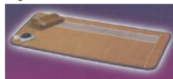
Kun de beste materialene er brukt i fremstillingen av Bio-matten.

Det er et bra julegavetips til deg selv eller andre!